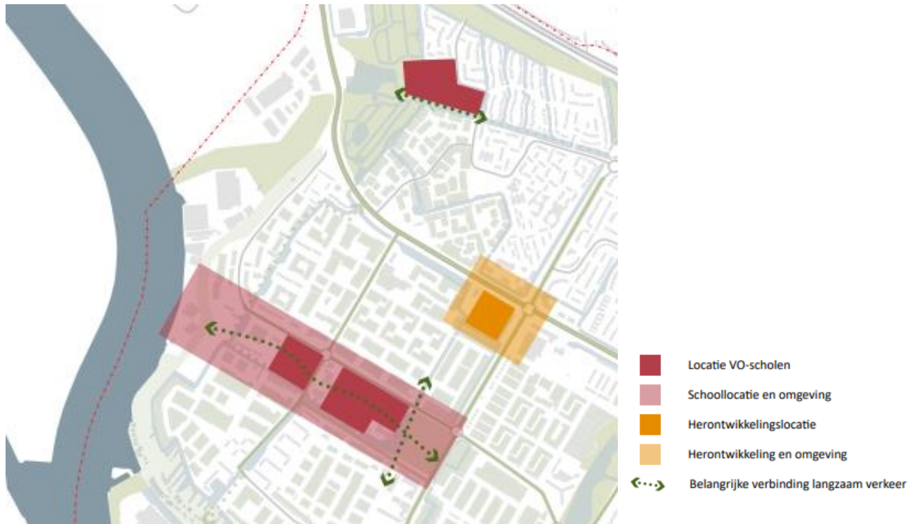
Figuur 1. Het projectgebied dat in beschouwing is genomen.

Het onderzoeksgebied waarvoor de duurzame kansen in dit memo worden omschreven omvat de drie locaties die in het haalbaarheidsonderzoek relevant zijn.