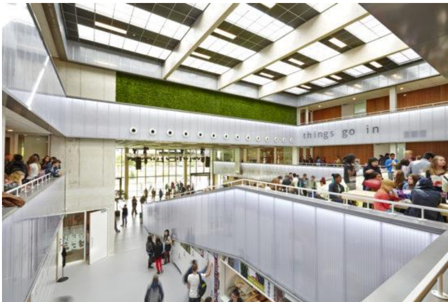
Lyceum Schravenlant in Schiedam, duurzaam schoolgebouw en gebouwd volgens Cradle-to-Cradle filosofie

Een frisse school is een schoolgebouw (basis- of voortgezet onderwijs) met een laag energiegebruik en een gezond binnenmilieu als het gaat om luchtkwaliteit, temperatuur, comfort, licht en geluid. Ook duurzaam materiaalgebruik in de school heeft invloed op het binnenklimaat. Hier dient aandacht voor te zijn in het vervolg traject.