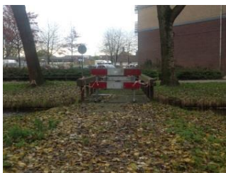
het bruggetje bij de Zernikelaan

Onafhankelijk Papendrecht stelt het achterstallig onderhoud van de publieke ruimte aan de orde. Wij brengen een amendement in op het raadsbesluit het bruggetje bij de Zernikelaan weg te halen. Jammergenoeg krijgen we geen steun van de andere partijen. Het onkruid tiert welig en straatstenen liggen scheef of los. Ook het bruggetje bij de Zernikelaan was niet meer begaanbaar omdat er gaten in het houten dek waren gevallen. Volgens ons had het bruggetje eerder kunnen worden gerepareerd. Er is veel bezuinigd op het Integraal Beheer Openbare Ruimte. Dat leidt tot verwaarlozing.