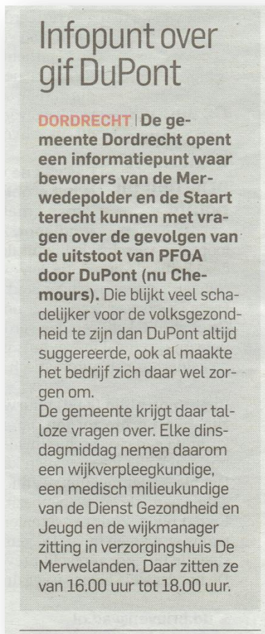
Figuur 3 AD Drechtsteden 7-8 mei